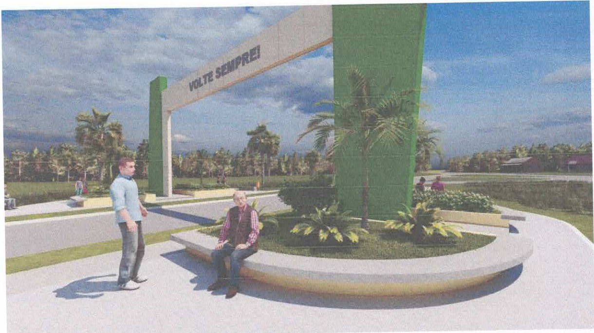
Foto 10: Praça no entorno do Portal com bancos, calçadas e jardim.