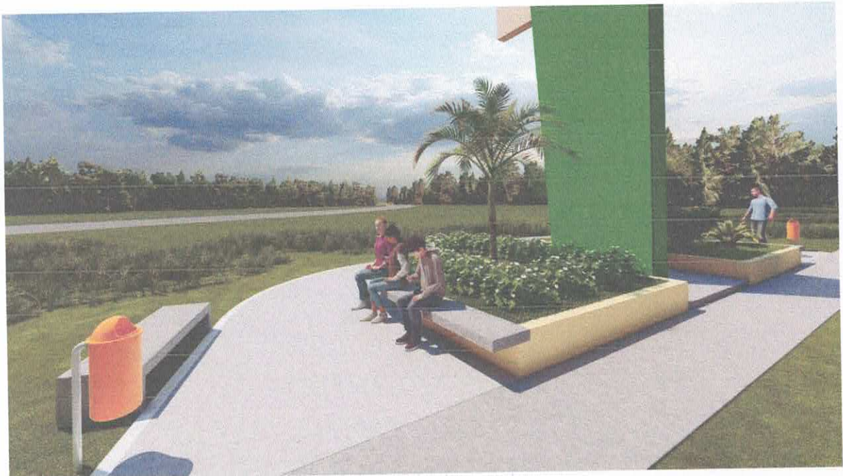
Foto 08: Praça no entorno do Portal com bancos, calçadas e jardim.