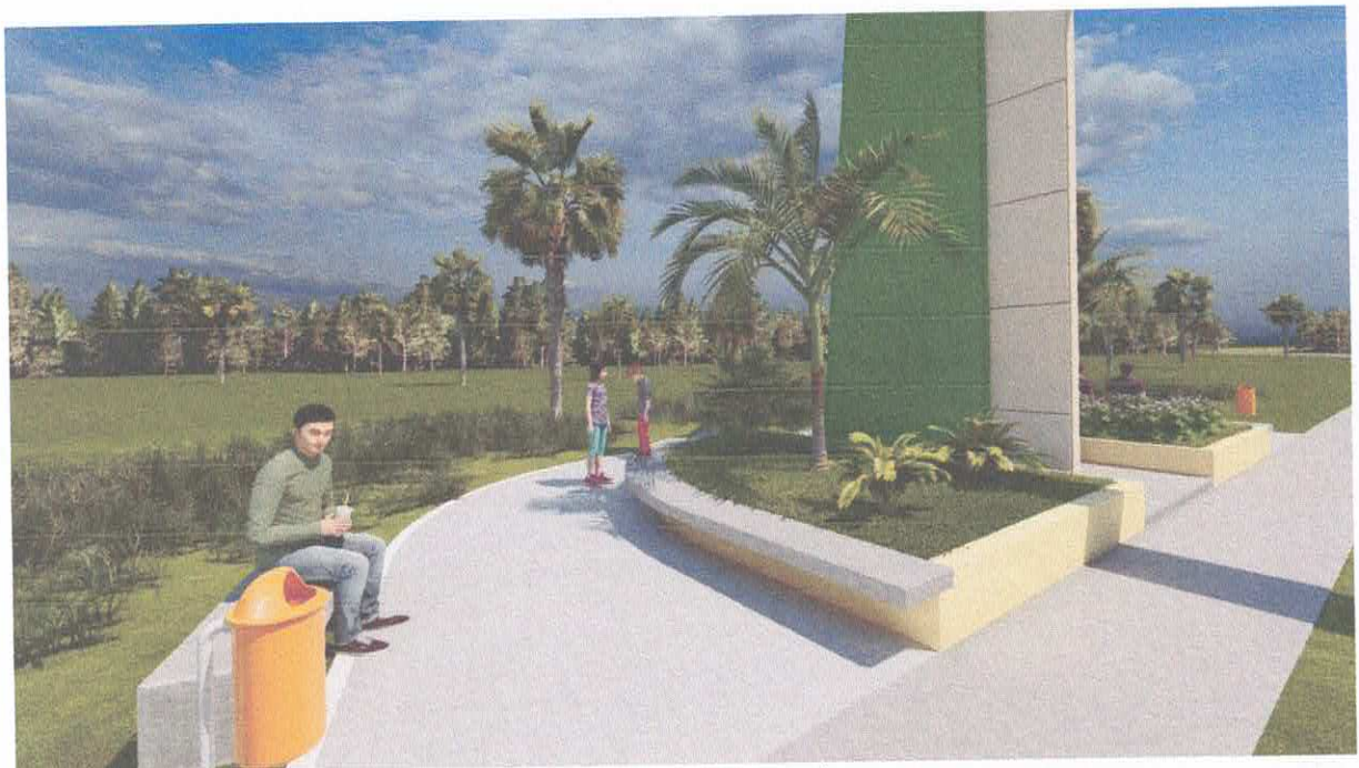
Foto 11: Praça no entorno do Portal com bancos, calçadas e jardim.