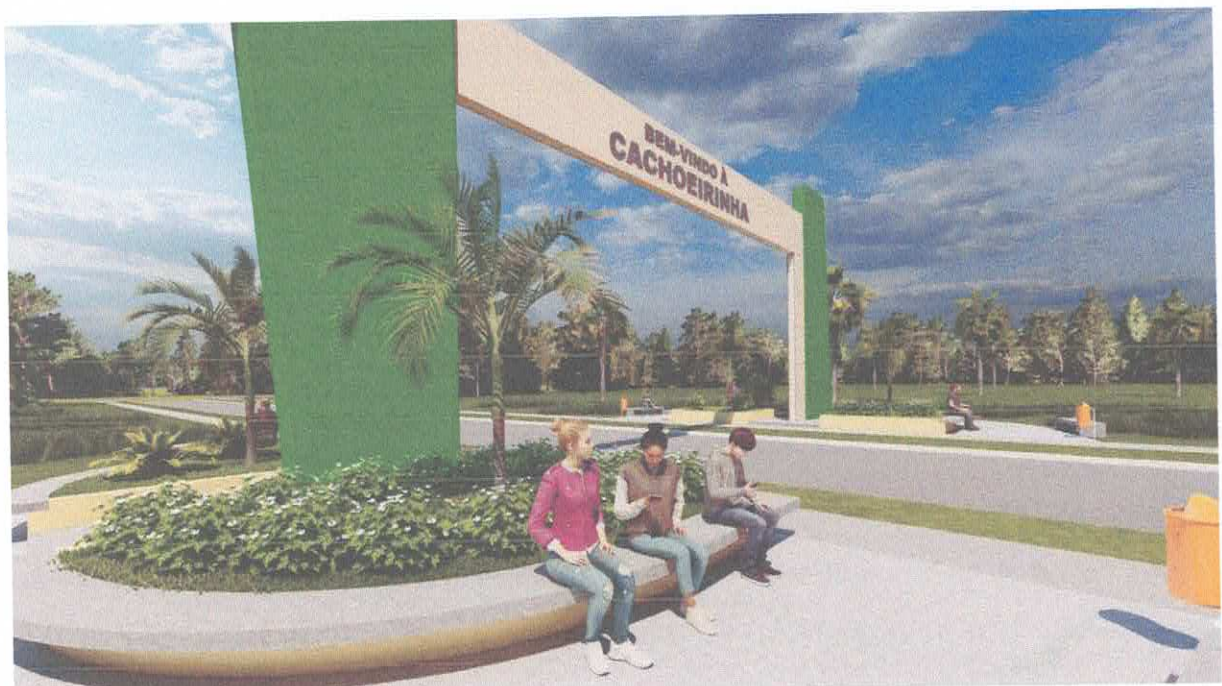
Foto 09: Praça no entorno do Portal com bancos, calçadas e jardim.