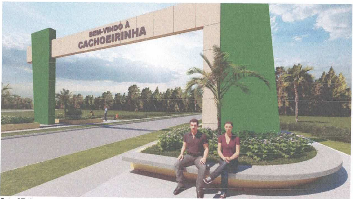
Foto 07: Praça no entorno do Portal com bancos, calçadas e jardim.