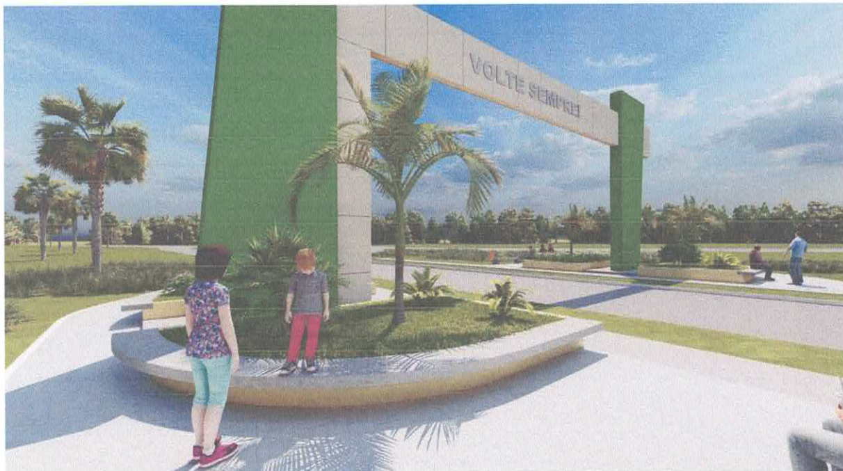
Foto 12: Praça no entorno do Portal com bancos, calçadas e jardim.